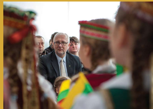
Gražiai lietuviškai dainavo Vidugirių, Pristavonių ir Navinykų vaikai

„Jei nebūtų mūsų dvasios pasiryžimo, tai gal jau nieko čia ir nebebūtų. Bet mes nenorime, kad Lietuva turėtų ko nors dėl mūsų atsisakyti, suprantame, jog Lietuva išlaiko tautinių mažumų mokyklas savo šalyje. Tad ar ne Lenkijos valstybės pareiga išlaikyti lietuviškas mokyklas Lenkijos teritorijoje?“