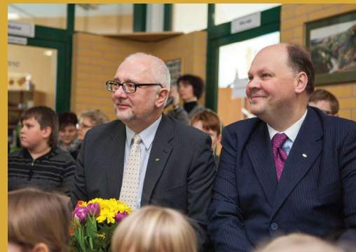
Mažieji „Žiburio“ čilbuonėliai pažėrė šypsenų...