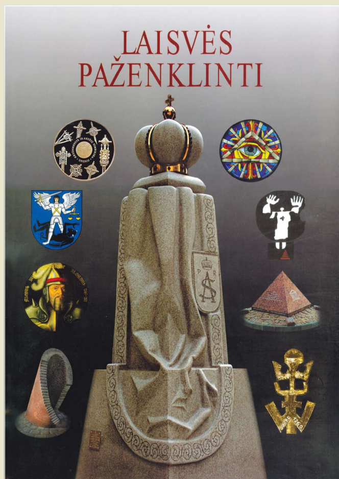
Lietuvos dailininkai – atkurta Lietuvos valstybei