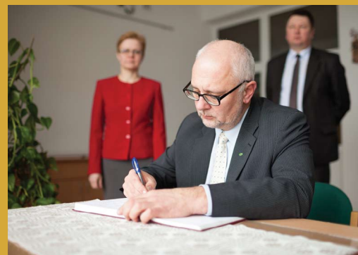
Švietimo ir mokslo ministro linkėjimai Punsko Kovo 11-osios licejaus metraštyje