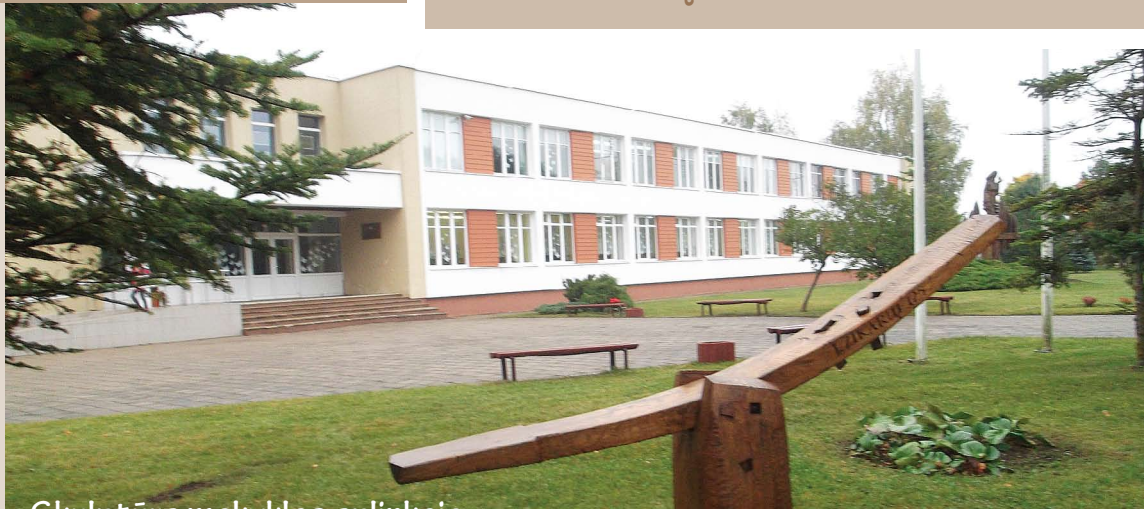
Skulptūra mokyklos aplinkoje