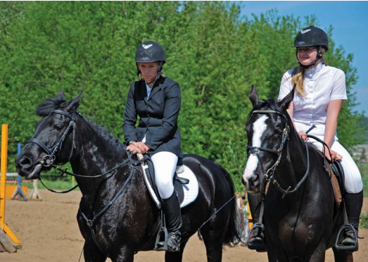
Gyvūnų priežiūros skyriaus organizuotojai bendruomeninėje popietėje Marvelės žirgynė