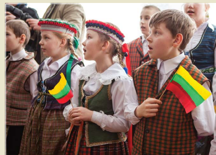
Kovo 11-oji Punsko ir Seinų lietuviškose mokyklose